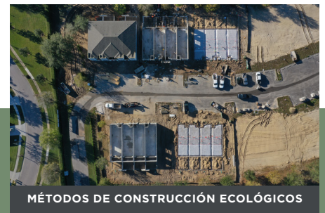
MÉTODOS DE CONSTRUCCIÓN ECOLÓGICOS

Nuestras casas continúan empujando nuestra industria al ofrecer acabados de lujo estándar, como encimeras de cuarzo de primera calidad, impresionantes gabinetes modernos, pisos de porcelana duraderos y electrodomésticos de acero inoxidable. Nuestras cocinas ofrecen herrajes Moen, iluminación colgante LED y enchufes de mostrador emergentes en cada plano de planta.