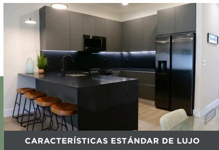
CARACTERÍSTICAS ESTÁNDAR DE LUJO

Cada una de nuestras casas adosadas Tranquility es el colmo del diseño moderno. Los exteriores luminosos y elegantes, complementados con elegantes trabajos en piedra, están elaborados con excelencia. Cada plano de planta cuenta con un diseño espacioso, acabados premium estándar y una piscina privada climatizada.