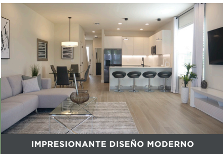
IMPRESIONANTE DISEÑO MODERNO

Tranquility es parte de nuestras comunidades de ensueño, que cuentan con más de 145 acres de desarrollo y se une a los otros cinco vecindarios, incluidos Hidden Forest, Serenity, The Retreat, Hidden Lakes y Sunrise Pointe. La comunidad fue diseñada con un paisaje frondoso, farolas solares y un ECO-CLUB.